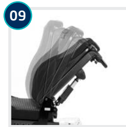
09 CODE 25