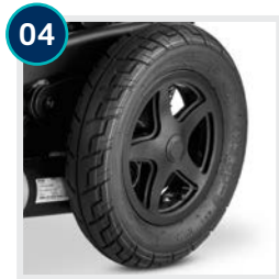
04 CODE 460