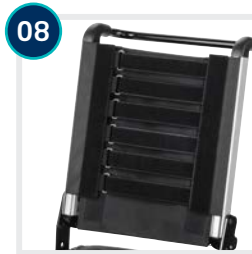
08 CODE 736/287